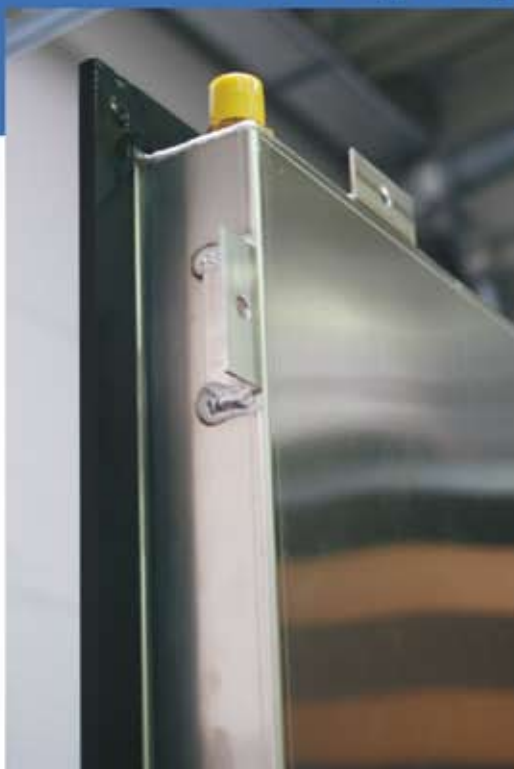
Osztrák piacra gyártott napkollektor-tálcák