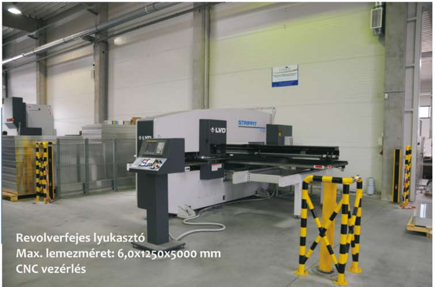
Revolvertejes lyukasztó Max. lemez méret: 6,0x1250x5000 mm CNC vezérlés