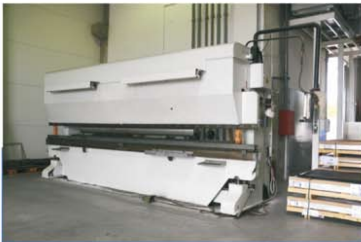
Hidraulikus élhajlító Max. lemezméret: 3,0x5000 mm