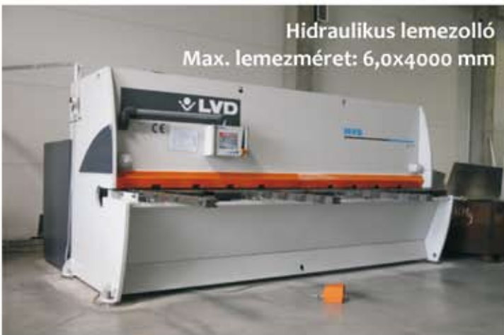
Hidraulikus lemezolló Max. lemez méret: 6,0x4000 mm