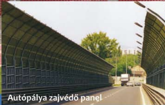
Autópálya zajvédő panel