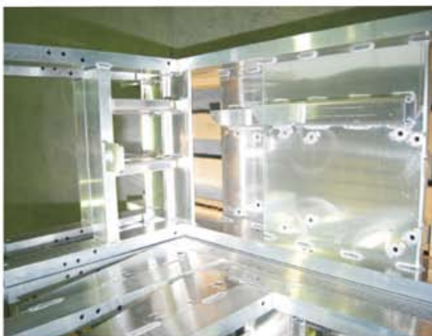
Szélerőművi felvonó hegesztett eleme