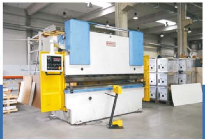
Hidraulikus élhajlító Max. lemezméret: 4,0x3000 mm