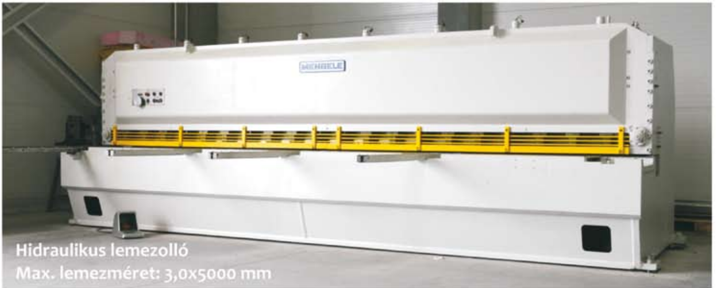
Hidraulikus lemezolló Max. lemezméret: 3,0x5000 mm