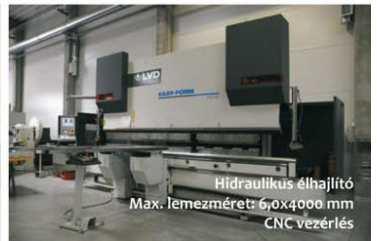
Hidraulikus élhajlító Max. lemez méret: 6,0x4000 mm CNC vezérlés